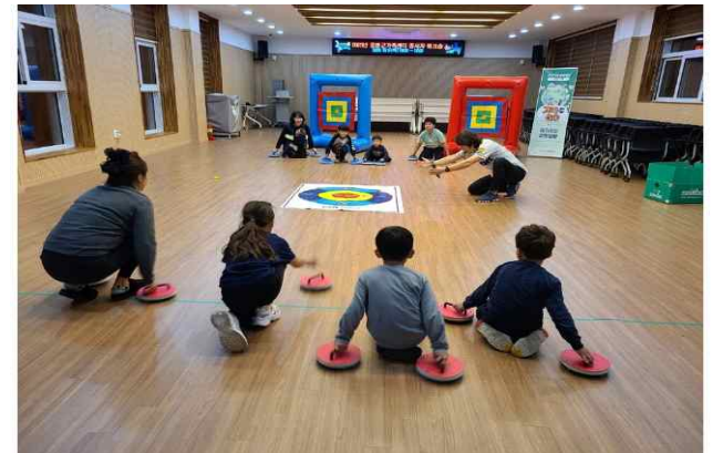
증평군이 지난 10~11월 진행한 군인가족 프로그램 가족 지키고, 슬기로운 군인생활

증평군은 지난 3월 '군부대와 교류·협력에 관한 조례'를 제정했다. 조례에는 군부대 행사 지원, 면회객 편의 지원, 군 장병 공공시설 사용료 감면 등을 담고 있다. 조례에 따라 지역 안 군부대장병 등을 위한 다양한 정책을 펴고 있는데 대표적인 게 '땡큐 솔저 1337'프로젝트다. '1337'은 지역 안 흑표부대(13공수특전여단)와 송유부대(육군 37보병사단)를 뜻한다.