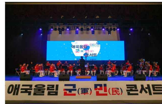
증평군이 지난 9월 9일 애국올림군(軍)민(民) 콘서트

증평군은 대표적 군 장병 친화 지자체다. 지역 안에 자리 잡은 군부대 지원 조례를 만들고, 병영 특화 거리까지 조성해 군 장병을 예우한다.